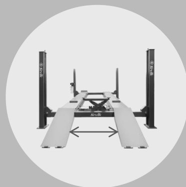
ПОЛОЖЕНИЕ 2 — 1000 ММ