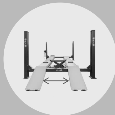
ПОЛОЖЕНИЕ 1 — 900 ММ