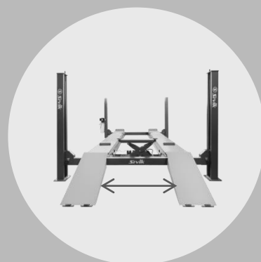
ПОЛОЖЕНИЕ 3 — 1100 ММ